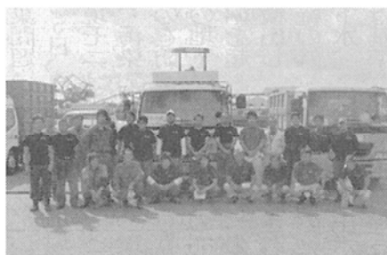
支援活動の参加者ら