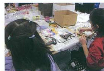
木の葉のリース作り