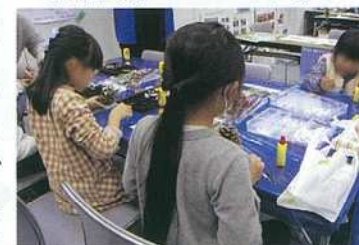
住友電装株 ミニツリー作り