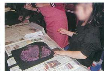
井村屋株 エコバック作り

フェアに協賛した当協会は、「木の葉とリサイクル製品の工作」で子供達にリース作りを楽しみいただき、当日排出された「廃棄物の分別指導と処理」を行いました。また、当協会会員の、井村屋(株)からエコバック作り、住友電装(株)からミニツリー作り、三重執鬼(株)のアロマキャンドル作り、万縁(有)からリサイクル瓦チップの展示、(一財)三重県環境保全事業団から省エネ診断等があり、始終賑わっていました。