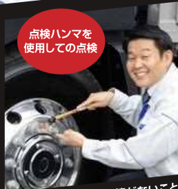
点検ハンマを 使用しての点検