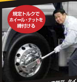
規定トルクで ホイール・ナットを 締付ける

タイヤ交換などホイール脱着時の不適切な扱いによる、 車輪脱落事故が発生しています！ 正しい取扱いをお願いします。 (確実な締付け作業)