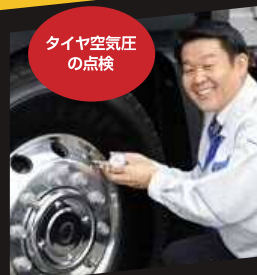
タイヤ空気圧 の点検

タイヤの空気圧、タイヤに亀裂や損傷、異状な摩擦がないこと、タイヤの溝の深さが十分あることも、しっかりと点検しましょう。