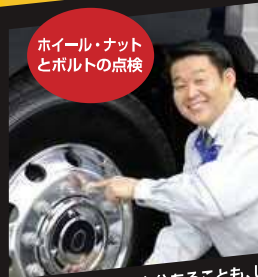
ホイール・ナット とボルトの点検