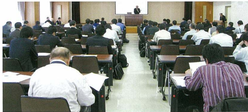
開かれた防災対策・災害廃棄物の講演会